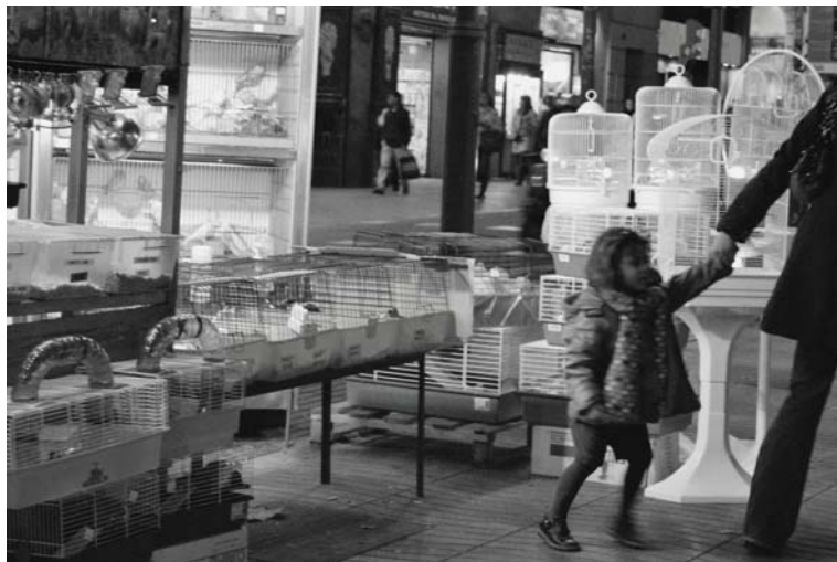
Puede utilizarse con fines no comerciales. https://www.flickr.com/photos/multe/4160860620

http://www.lavanguardia.com/vida/20100416/53908253112/la-rambla-se-queda-sin-puestos-de-animales.html